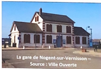
La gare de Nogent-sur-Vernisson