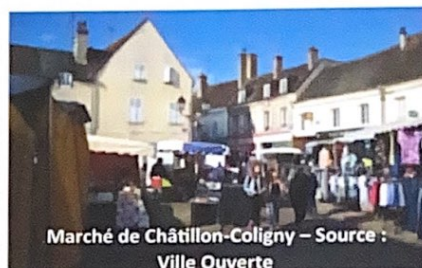
Marché de Châtillon-Coligny