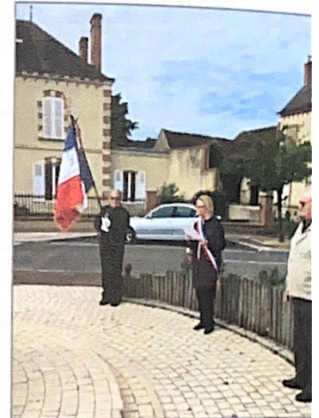
Cérémonie du 8 mai

Merci aux personnes qui se sont mobilisées et ont ainsi pu soulager les plus fragiles d'entre nous !